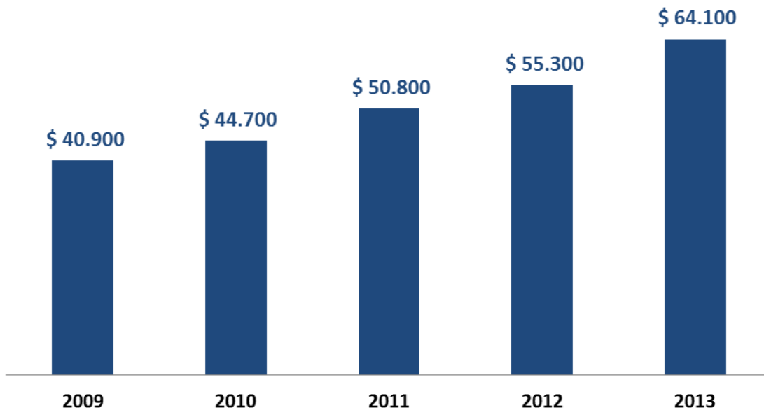
Figura 2: Fondo Nacional de Desarrollo Regional (M) Región de Antofagasta